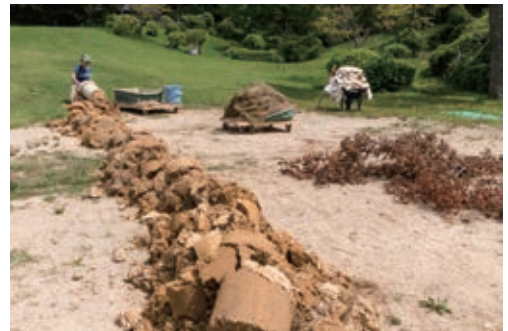
6 野村由香《繰り返される営み》2019

野村由香は、日常生活や社会、自然に通底する根源的な力に関心を寄せ、現場での観察や介入を通して、その作用やベクトル、そこに流れる固有の時間を、彫刻やインスタレーションとして可視化してきました。本展では、犀川で採取される「砂金」に着目し、新作を発表します。