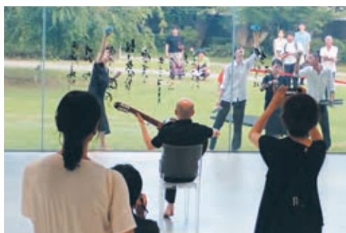
2019年度「まるびい Art Complex」の様子

多様なパフォーマンスとの出会いをきっかけに、鑑賞のあり方そのものが変化していくシーズンです。一つの演目を目的に訪れるだけでなく、同じ時期に行われるダンス、演劇などの様々なパフォーマンスやワークショップ、対話といった出来事に触れながら美術館を巡ることで経験が連なり、次に出会う作品や展示をどう見るかという視点に静かな影響を与えていきます。一つの鑑賞が次の鑑賞へと繋がっていく時間が美術館の中で立ち上がります。