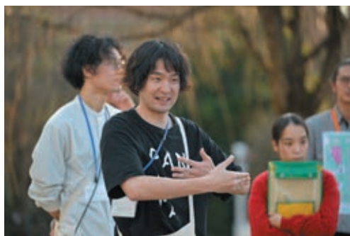
ワークショップ「あなたの当たり前、わたしの当たり前」活動風景 (2025年12月)

「生きることを面白い」をテーマに掲げるパフォーマンス・ユニットの滞在制作活動を行います。昨年度は「演劇に興味がある/美術館に興味があるが、あまり行かない」人たちと出会うため、市内調査や館内ワークショップを行いました。そのご縁をもとに、今年度は人それぞれの「当たり前」について、見つめ直す活動をさまざまな場所で実践します。その成果として、多世代で多様な人たちが演劇的な創作発表を美術館で行い、新たなご縁をつむぐ機会を設けます。