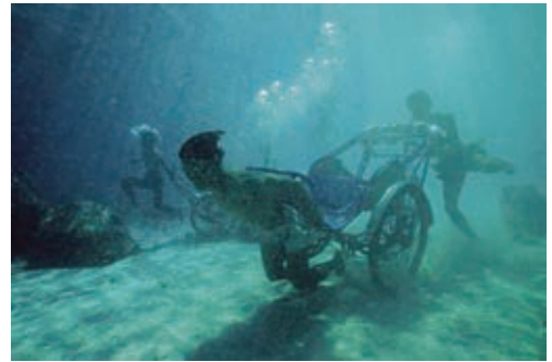
3 ジュン・グエン=ハツシバ《メモリアル・プロジェクト ナ・トラン、ヴェトナム:複雑さへー勇氣ある者、好奇心のある者、そして臆病者のために》2001 © JUN NGUYEN-HATSUSHIBA, courtesy: Mizuma Art Gallery, Tokyo / the artist Commissioned by Yokohama Triennale 2001

「歩く」あるいは「移動する」という行為を切り口に、当館のコレクション作品を紹介します。展示作品には、一步踏み出すという行為を起点に、外の世界を観察すること、思考や記憶の内側へと分け入ること、また、歩く人が位置する場所が生じる摩擦や、場所との関係性のなかで交渉する姿など、さまざまな「歩み」があらわれます。歩く、とどまる、というシンプルな行為から、観察、抵抗、記憶や時間への思考といった、多様な態度へとつながる実践を通して、人と空間、そして社会との関係性を浮かび上がらせます。