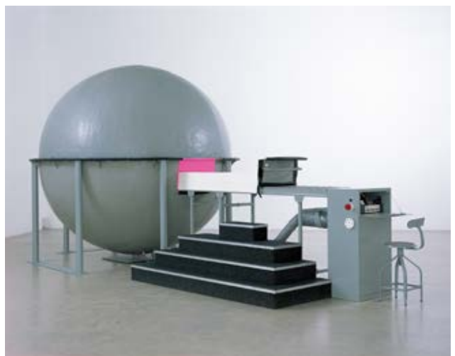
ジェームズ・タレル《ガスワークス》1993

長期休館を控えた美術館の現在地を見つめ直し、作品を未来へ継承することの意味を問い直す展覧会です。「今日」は現代美術における「現代」=「いま」、そして当館が開館してからの約20年を指し、「明日」は休館後から次の20年以降を想定しています。美術館は本来、百年、千年先まで作品を残す使命を担いますが、不確実な現代において、まず20年先まで作品をどう残すかという現実的な課題に21世紀の美術館として向き合います。本展では、修復や継承方法の検討を要する所蔵作品を中心に、ミクスト・メディアやメディア・アート、インスタレーション作品の保存にまつわる課題を具体的に提示し、作品とその修復や継承のプロセスを一体として示すことで、美術館のこれからの役割と姿勢を明らかにします。