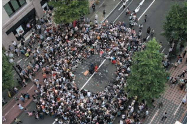
ギリヤークニケ崎 札幌公演(2018年8月)

1986年に赤瀬川原平や藤森照信らにより結成された「路上観察学会」は、変わりゆく都市のなかで、路上を観察し、読み替える目を提示しました。それから40年を経た今年、本展では、現代美術から歴史的資料、テレビゲームや銭湯、大道芸までもを紹介しながら、路上は誰のものか?をキーワードに、路上の公共性を探ります。批評とユーモアの喧騒に溢れた、路上の芸術に出会いにきてください。