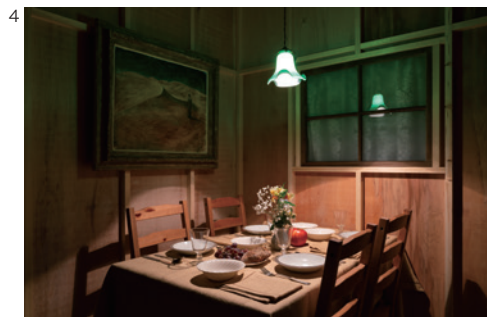
4 富安由真《Making All Things Equal》2019 アートフロントギャラリー展示風景 ©Yuma Tomiyasu