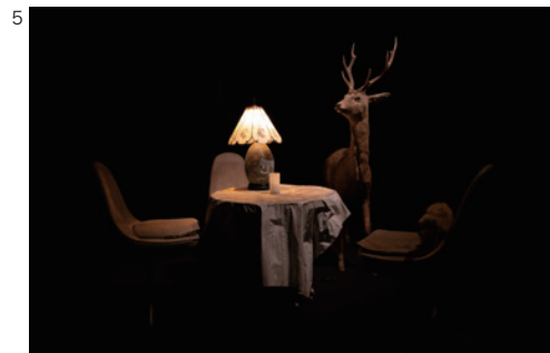
5 富安由真《漂泊する幻影》2021 KAAT 神奈川芸術劇場〈中スタジオ〉展示風景 ©Yuma Tomiyasu 撮影：西野正将