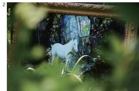
2 富安由真《The Pale Horse 蒼ざめた馬》2021

※アーカイヴのため、後日、掲載誌（紙）、URL、番組収録のDVD、CDなどをお送りください。以上、ご理解・ご協力のほど、何とぞよろしくお願いたします。