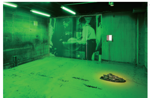
まちなか展覧会「変容する家」の展示風景《Bonjour Monsieur Bon Yamajun》2018 Photo: KIOKU Keizo © Moon K yungwon & Jeon Joonho