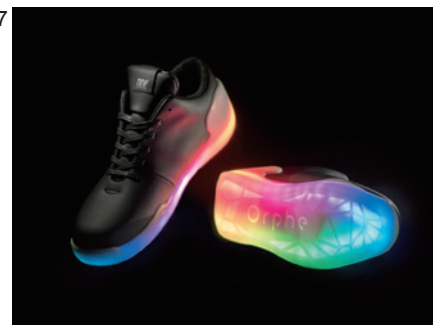
Orphe Black Model (ORPF - 01B)