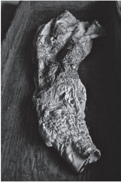
5 沖潤子《つばめ》2015年 Oki Junko, a swallow , 2015