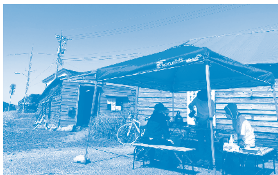
ある日の週末屋台。挽きたてのコーヒーとお菓子で青空カフェができました

★週末屋台 だいたい毎週土曜14時〜17時頃 週末コンテナ、週末コタツに続く、第三段！今回は「屋台」です。週末屋台には決まりはありません。子供から大人まで誰でも店長になれます。「八百屋さんをやりたい／おいしいコーヒーをみんなで飲みたい／朗読会をしたい／作った小物を販売したい」等、なんでもあり。 やりたいことがあるけどどう進めれば良いかわからない・一人でやるには心配という方もお気軽にご相談ください。スタジオにある備品(テント・机・椅子等)は自由にお使いいただけます。