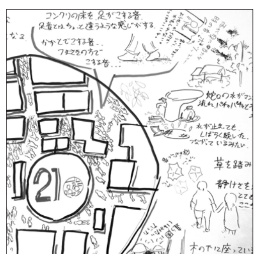
ワークショップ作品「美術館サウンド地図」(9月22日)